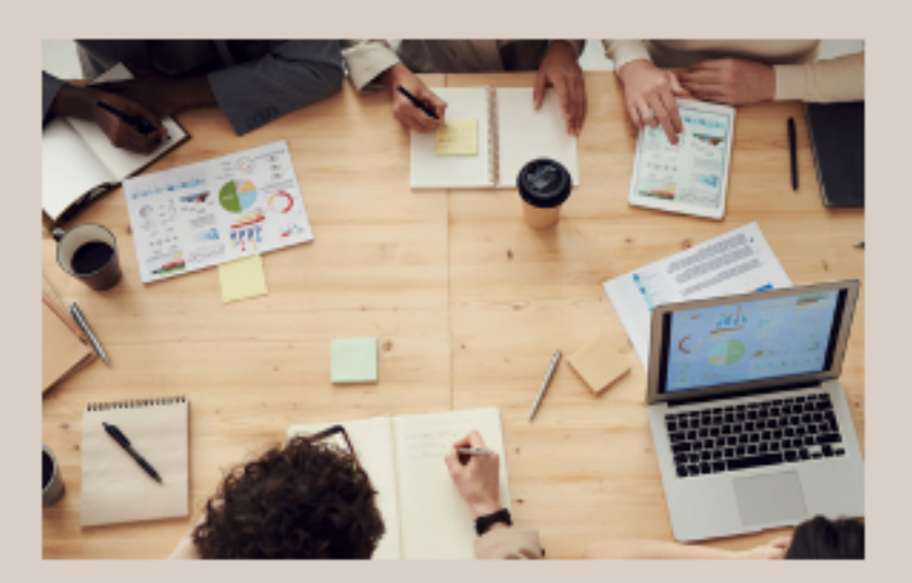
> 25 Collaborators... of which 80% women